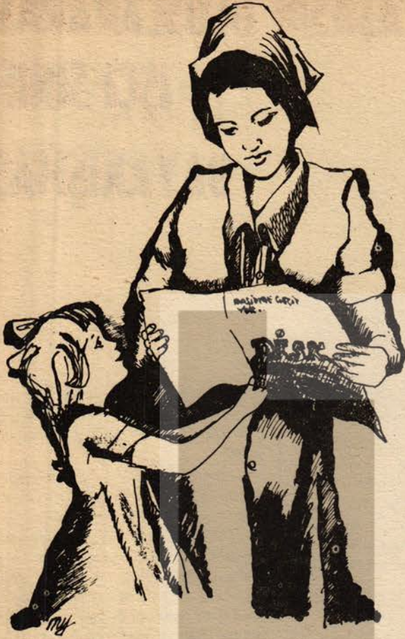
Neyir'den bir Bayan işçi

Çevremize şöyle bir baktığımızda kadınlarımızın ne kadar geri bıraktıldığını, ezildiğini, bilinçsiz hatta cahil kalmaya mahkûm edildiğini kolayca görebiliriz.